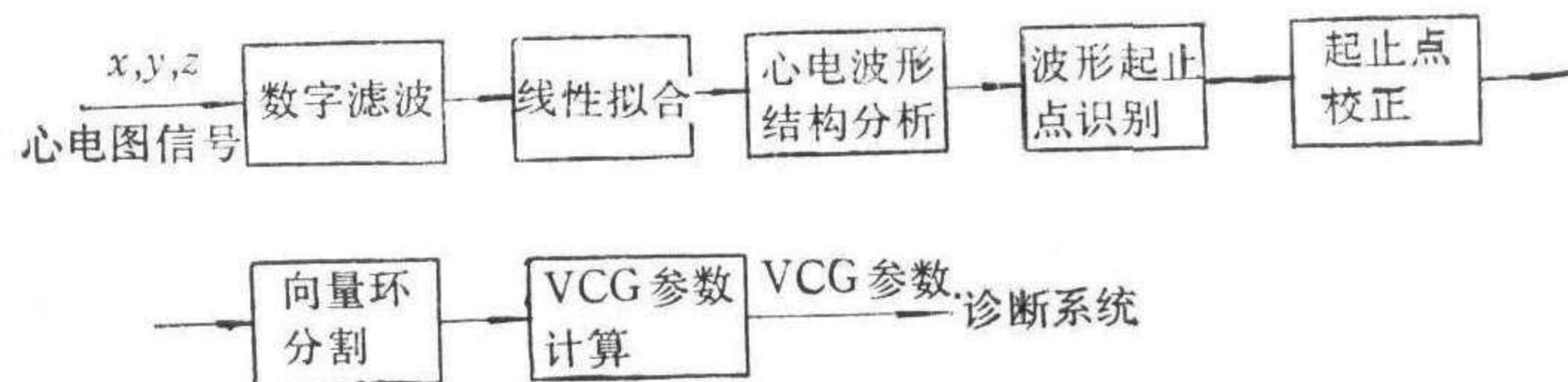
图2 VCG-CARD 图形自动分析识别流程图

识别过程从 QRS 波开始,然后是 T, P 波。T, P 波识别可仿照 QRS 的方法。心电波形的上下文关系对于识别来说是很重要的信息。为此引入带有属性的正则文法来完成图形结构分析。正则文法可由确定的有限状态自动机实现。