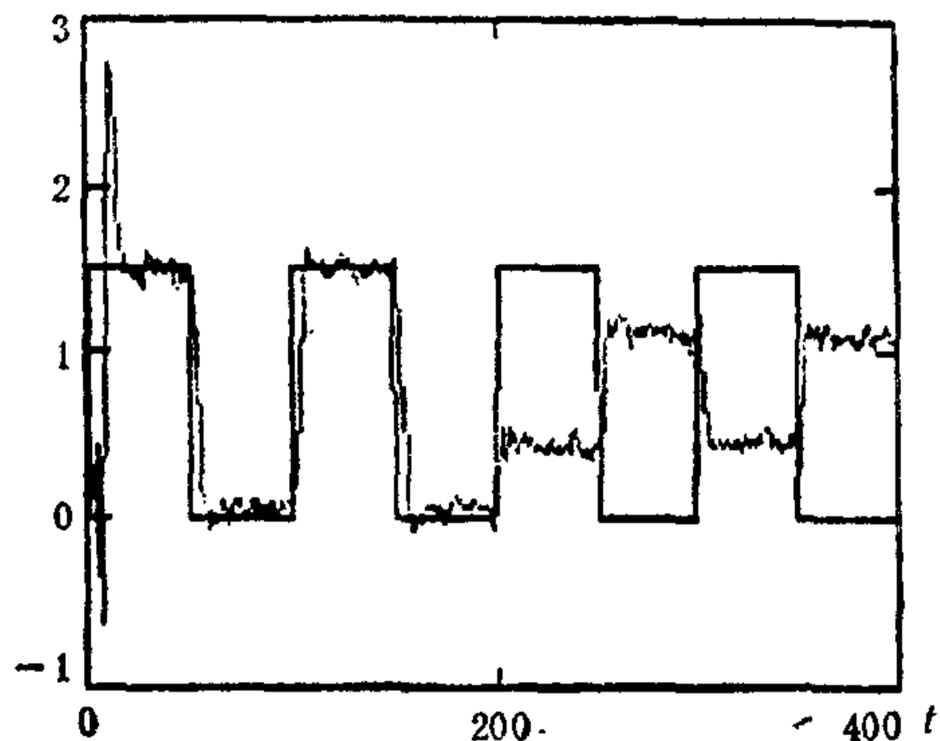
图 3 参考输入 r_2(t) 及输出 y_2(t)

本文对参数未知的随机多变量系统的执行机构卡死情况提出了一种简单的自适应容错控制算法。对传感器的卡死情况, 以及加权阵的在线选取, 系统性能优化等还有待于研究。