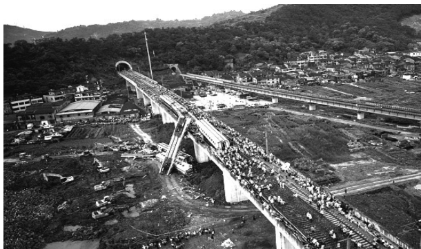
(b) 2011 年中国甬温线动车组追尾事故 [4]