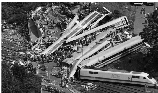
(a) 1998 年德国高速列车 ICE 出轨事故 [3]

展较早且技术成熟,适用于被监控对象数学模型精确已知的情形 [1] . 相比之下,基于数据和知识的方法无需已知系统的精确模型,分别适用于大量历史数据可得和系统知识及专家经验已知的情形 [14-15] . Dai 等 [16] 从数据驱动的角度对上述三类故障诊断方法进行了分析与对比,指出这些方法的不同之处在于如何处理数据以及如何发掘和利用隐藏在数据背后的有用信息. 考虑到新的故障诊断方法层出不穷,文献 [10] 从一个新的角度对现有方法进行了重新分类,将其整体上分为定性分析方法和定量分析方法两大类. 其中,定性分析方法包括图论方法、专家系统和定性仿真方法;定量分析方法包括基于解析模型的方法和数据驱动的方法. 不同类别的方法各有千秋,具体采用哪种方法或哪些方法的组合需要针对实际被监控对象,在充分发掘对象特性与知识的基础上,充分利用可以获得的对象信息(模型或数据),选择合适的方法更好地实现故障诊断任务,提高系统可靠性与安全性.