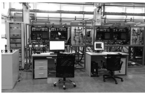
图2 高速列车制动试验台 [69]

统, 对应于我国某型号动车组制动系统. 试验台上安装的制动设备与实际运营动车组上的制动设备相同, 并可以完成多种制动模式/级别的测试. 文献 [69–70] 针对动车组制动缸子系统, 提出一种新的故障检测指标和故障分离策略, 用于制动缸压力传感器故障、制动缸性能退化以及气体泄漏故障的检测与分离, 并进行了实验验证, 所提方法有效并优于当前故障诊断逻辑. 文献 [71] 针对制动系统气制动泄漏故障的特点, 基于字典建立和稀疏表示工具提出了一种针对泄漏故障的快速检测方法. 针对微小故障检测问题, 文献 [72] 将平滑技术引入到多元统计监控领域, 提出两种微小故障检测指标, 并将其应用于制动系统压力传感器的多重微小故障检测, 实验验证了方法的有效性.